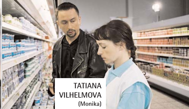
TATIANA VILHELMOVA (Monika)

Nació en Praga en 1978 y se dio a conocer por su interpretación en la obra de Chéjov, "El jardín de los cerezos". Es miembro de la compañía de teatro Dejvicka Theatre de Praga y ha sido nominada dos veces al prestigioso Premio Alfred Radok. Debutó en la gran pantalla en 1995 en la película Indianske Leto (El veranillo de san Martín). Ha sido nominada seis veces al León a la Mejor Actriz por la Academia de Cine checa.