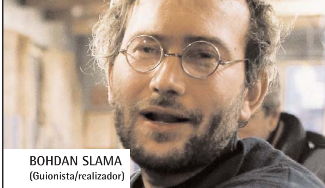
BOHDAN SLAMA (Guionista/realizador)

Nació en Opava, República Checa, en 1967. Después de licenciarse en la Universidad Técnica de Chequia, estudió en la FAMU, la escuela de cine de Praga. Su primer corto, Zahradka Raje (Jardín del paraíso), fue premiado en varios festivales internacionales.