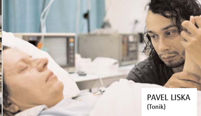
PAVEL LISKA (Tonik)

Nació en 1971. Estudió arte dramático en la Escuela de Teatro de Brno antes de unirse a la compañía de teatro HaDivadla. Debutó en el cine en 1999 interpretando el papel protagonista de la película Navrat idiota (El regreso del idiota), de Sasa Gedeon. Ha sido nominado a dos Leones por la Academia checa.