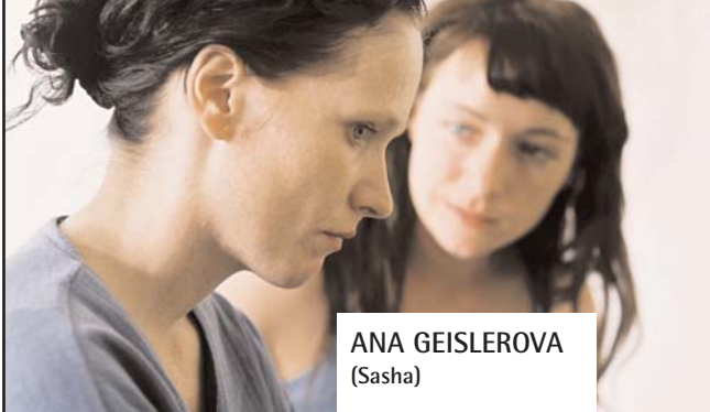
ANA GEISLEROVA (Sasha)

Nació en Praga en 1978. Debutó en la gran pantalla a los 12 años y ha sido modelo. De las tres nominaciones a un León a la Mejor Actriz por la Academia checa, ha ganado dos. La primera en 1999 por su interpretación en Navrat idiota (El regreso del idiota), de Sasa Gedeon, y la segunda en 2003 por Zelary, de Ondrej Trojan, película nominada al Oscar a la Mejor Película de Habla No Inglesa.